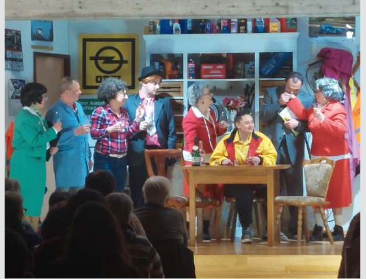
Heftlesspicker am 31.01.2026

Montag, 23. März, 19–ca. 21 Uhr im Café Bö, Haslacher Weg 89 Veranstalter: Netzwerk Böfingen e.V. Anmeldung über: m.bauerle@netzwerk-boefingen.de