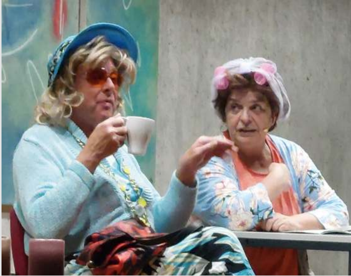
Hillus Herzdopfa am 13.12.2025 in Böfingen