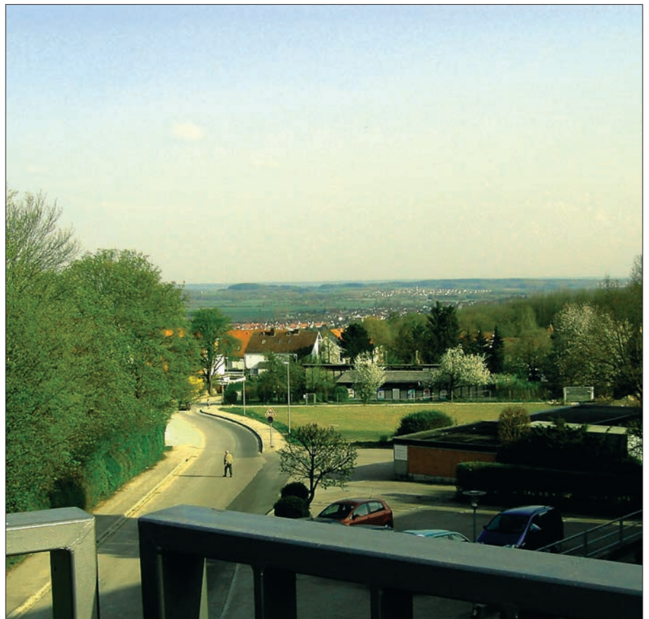
Vom Parkdeck im Einkaufszentrum hat man an schönen Tagen einen herrlichen Ausblick.