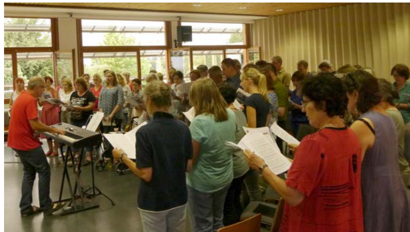
Der neue Popchor Ulm wurde am 4. März gegründet.

Ein neuer Stern am Ulmer Chorchimmel ist erstrahlt! „Popchor Ulm e.V.“, geboren am 4. März 2017 mit bisweilen knapp 50 Mitgliedern.