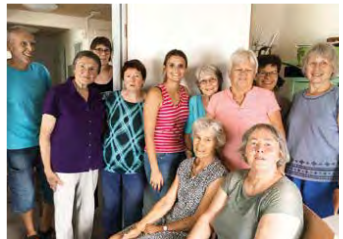
Mit Rat und Tat für die Geflüchteten da: der Helferkreis.

Seit April 2017 haben Familien und Singles aus Syrien, Irak, Ghana, Gambia die Wohnungen als Anschlussunterbringung bezogen. Inzwischen sind 26 Wohnungen vergeben, insgesamt sind es 61 Erwachsene und 53 Kinder und Jugendliche . Ein Haus wird derzeit zu einem Kindergarten umgebaut. Dieser soll am 1. September eröffnen.