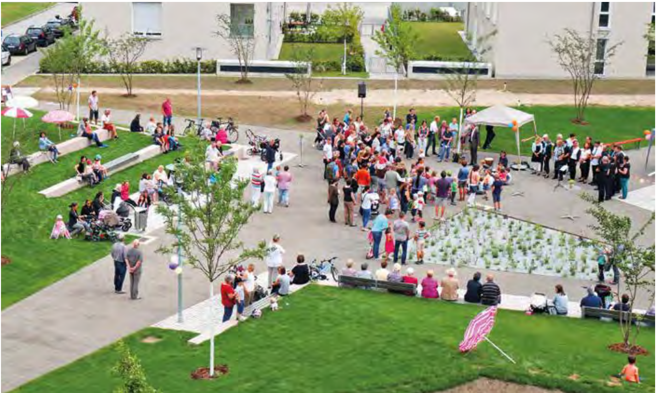
Sitzen, spielen und das Grün genießen – der neue Quartiersplatz im Lettenwald macht es möglich.