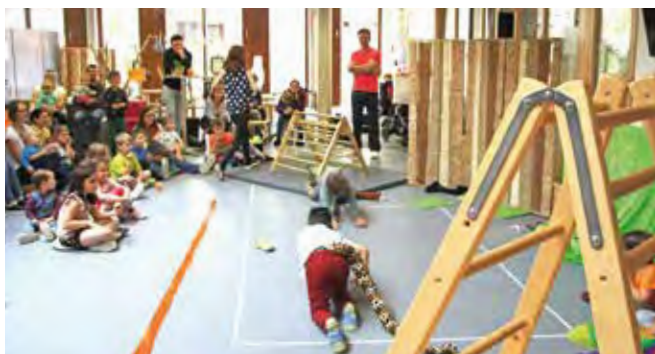
Selbst kreiert: Das Kindertheaterstück des KiFaZ.