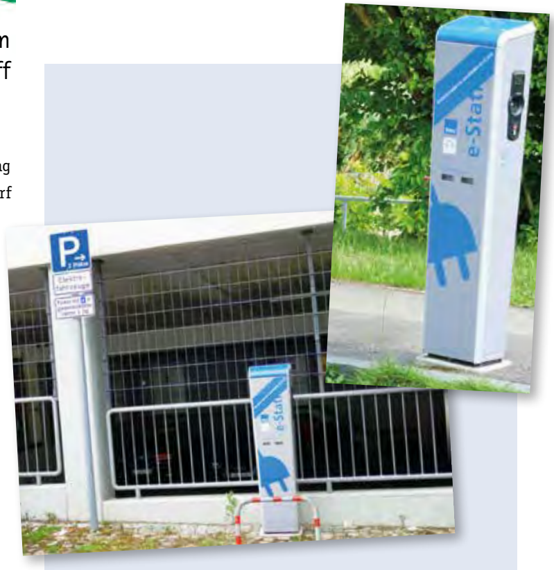
Die Böfing er Stromtankstellen: links die im Haslacher Weg, rechts die in der Wilhelm-Leuschner-Straße

Böfingen bleibt jedoch im Trend der Zeit: Von den 54 Ulmer Ladesäulen für Elektroautos befinden sich zwei hier oben bei uns. Eine steht in der Wilhelm-Leuschner-Straße unterhalb der Radarstation bei der Hochschule und eine weitere im Haslacher Weg neben den Glascontainern im unteren Bereich des Einkaufszentrums. sk