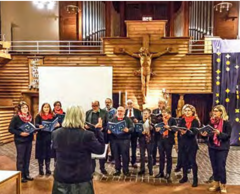
Die Bö'Singers in der evangelischen Kirche.