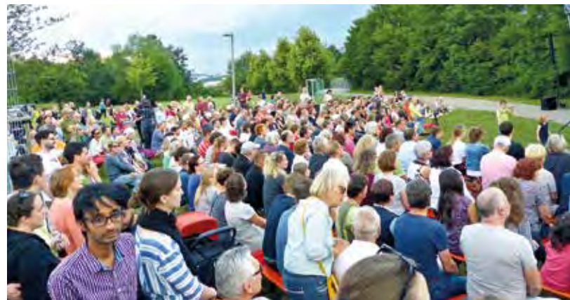
Großer Andrang beim Popchor-Open-Air trotz durchwachsenen Wetters.