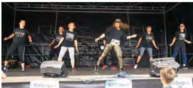
Die Zumba-Gruppe brachte Schwung auf die Bühne.

Auf der Bühne sorgte die Gruppe „Afterglow“ für eine Superstimmung, dazwischen gab es Vorführungen vom Schulchor der Eduard-Mörrike-Schule, den Ropeskipperinnen des SC Staig, der Zumbagruppe und den HipHop-Minnies des VfL, außerdem spielte noch die BigBand des Schubartgymnasiums auf. Das Angebot an Speisen und Getränken war äußerst vielfältig, so dass keiner hungrig nach Hause musste. Insgesamt wieder ein erfolgreiches Fest für alle Böfing er, das ermöglicht wird durch eine Vielzahl an zupackenden helfenden Händen und einigen großzügigen Sponsoren – herzlichen Dank!