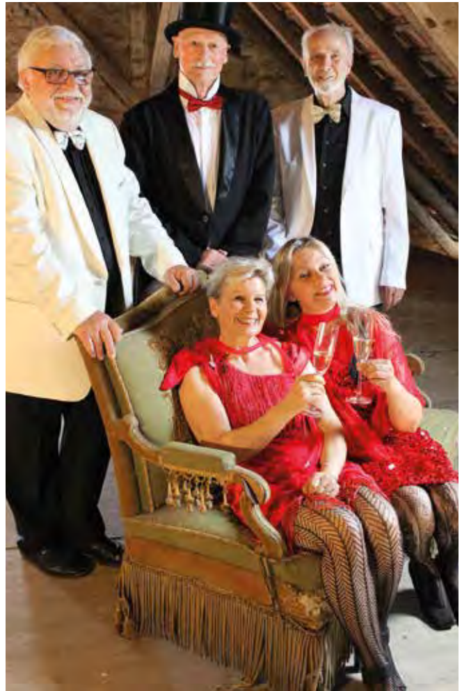
die untertoener kommen wieder nach Böfingen.